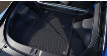
Filet à bagages CHF 60