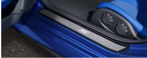
Tôles de marche pied éclairées (argent) avec Acc. Service Connector CHF 374