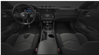
Équipement de série