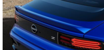
Spoiler arrière (uniquement pour la version Sport), montage inclus CHF 990