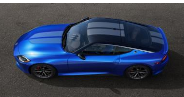
Double bande de course, spoiler arrière inclus CHF 900