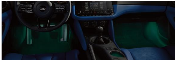
Eclairage intérieur d'accentuation avec Accessory Service Connector CHF 524