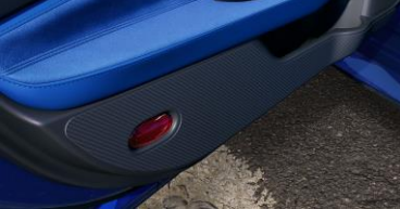
Protection contre les frottements pour l'intérieur des portes CHF 130