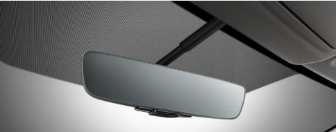
Rétroviseur sans cadre, à atténuation automatique de la luminosité CHF 420