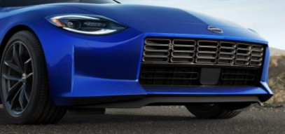
Spoiler avant (uniquement pour la version Sport), montage inclus CHF 390