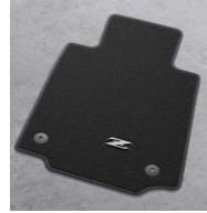
Tapis de sol Premium (avec logo Z) CHF 300