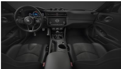
Équipement de série