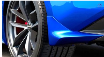
Protection anti-éclaboussures à l'arrière CHF 170