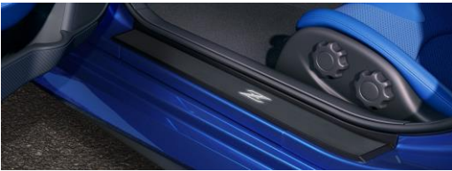
Tôles de marche pied éclairées (noir) avec Acc. Serv. Connector CHF 544