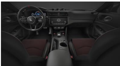
Équipement de série