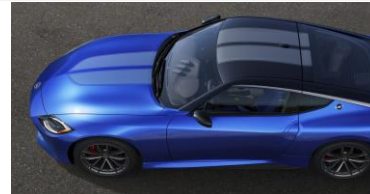
Double bande de course sans spoiler arrière CHF 800