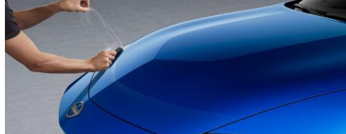
Protection du capot CHF 250