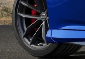
Protection anti-éclaboussures à l'avant CHF 145