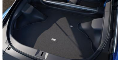
Protection pour le coffre - Moquette CHF 130