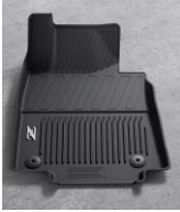
Tapis de sol toute saison - High Wall Liner CHF 280